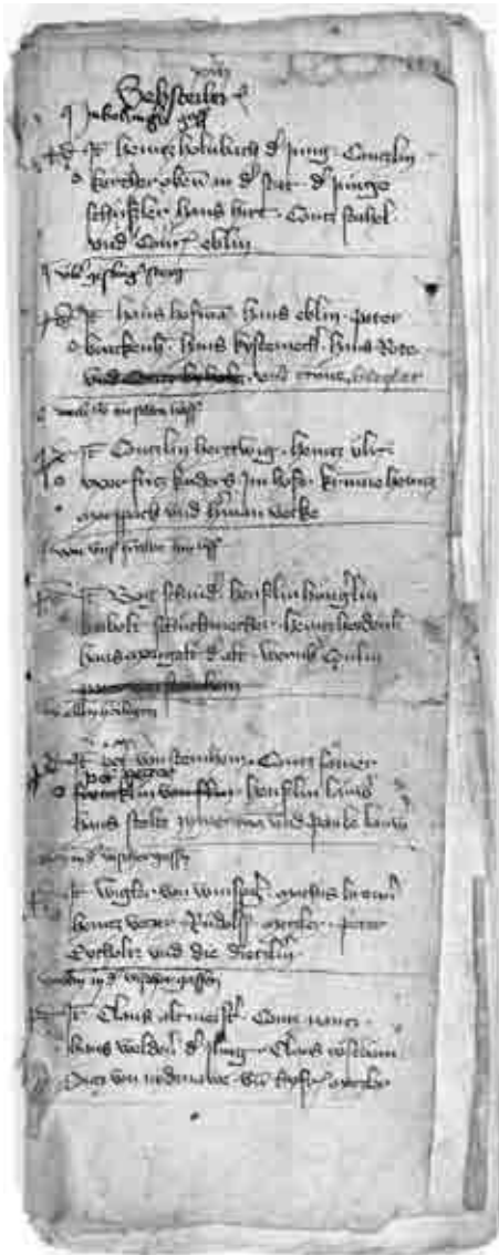
Seite 13 des Neuensteiner Fragments. (Hohenlobe-Zentralarchiv Neuenstein GHA P/9)