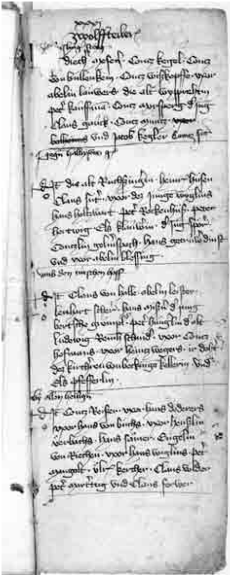
Seite 31 des Neuensteiner Fragments. (Hohenlobe-Zentralarchiv Neuenstein GHA P/9)