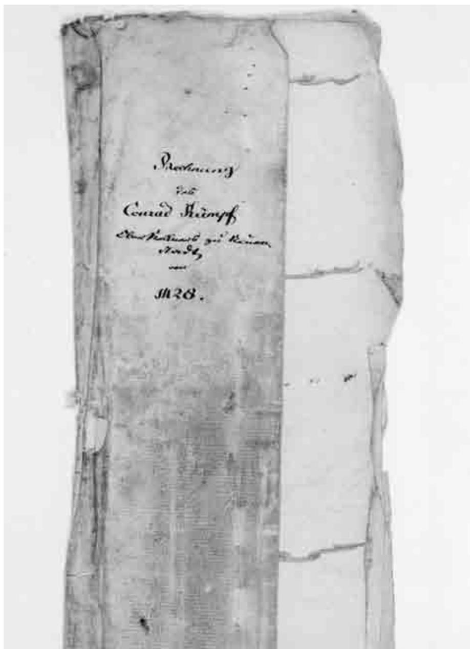
Hefdeckel der Weinsberger Rechnung von 1428. (Hohenlohe-Zentralarchiv Neuenstein GHA P/9)