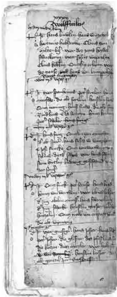
Seite 32 des Neuensteiner Fragments. (Hohenlohe-Zentralarchiv Neuenstein GHA P/9)