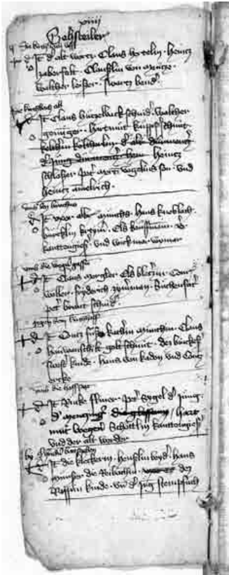
Seite 14 des Neuensteiner Fragments. (Hohenlohe-Zentralarchiv Neuenstein GHA P/9)