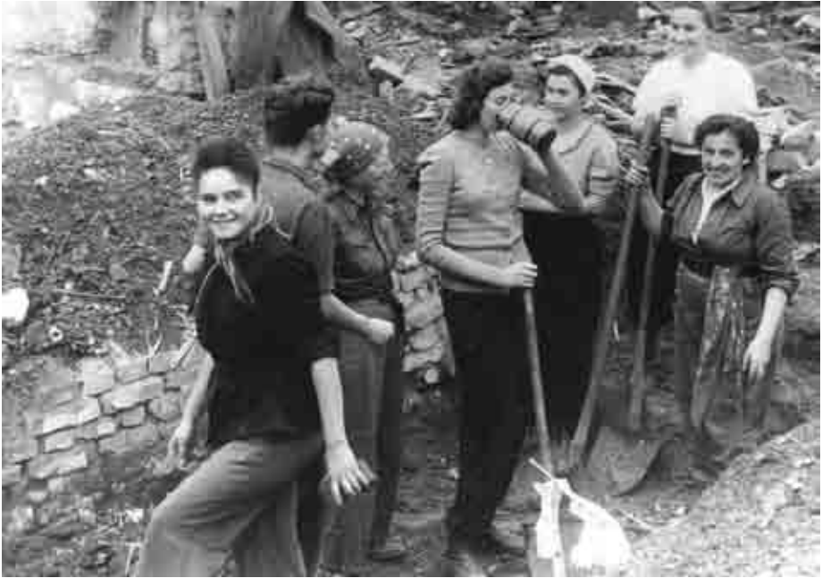
Trümmerfrauen – als zeitgenössischer Begriff der Nachkriegszeit benutzt für die Frauen, die vom Arbeitsamt oder anderen Behörden meist gegen Bezahlung zur öffentlichen Trümmerräumung verpflichtet wurden.

den alltäglichen Kampf ums Überleben für sich zu gewinnen. 2 Diese Frauen wurden so zum pater familias 3 – allerdings meist nur bis zur Rückkehr der überlebenden Männer aus der Kriegsgefangenschaft. Auch in den Städten, in denen keine Frauen zum Aufräumdienst verpflichtet worden waren, lag also die Verantwortung für die Familie und deren Versorgung sehr oft in Frauenhänden. Diese Frauen wurden später ebenfalls als „Trümmerfrauen“ bezeichnet, da sie ein neues Leben zwischen Trümmern aufgebaut hatten.