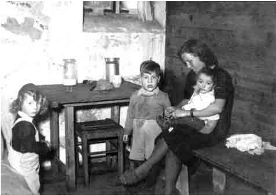
Trümmerfrauen – im Rückblick erweiterte Bezeichnung für alle Frauen der Kriegs- und Nachkriegsgeneration, die in den zerstörten Städten den alltäglichen Kampf ums Überleben führten.

sich beim Arbeitsamt melden mussten und dort offiziell als Trümmerfrauen registriert wurden. Diese Trümmerfrauen standen somit in einem Arbeitsverhältnis, hatten feste Arbeitszeiten, wurden vom Berliner Magistrat in Reichsmark bezahlt und bekamen darüber hinaus bei Vorlage ihres Arbeitsbuchs eine Lebensmittelkarte II für Schwerarbeiter. Die zweite Definition hingegen subsumiert unter dem Begriff „Trümmerfrau“ alle Frauen, die nach dem Zweiten Weltkrieg entbehrungsvoll ein neues Leben auf Trümmern errichten mussten. 5