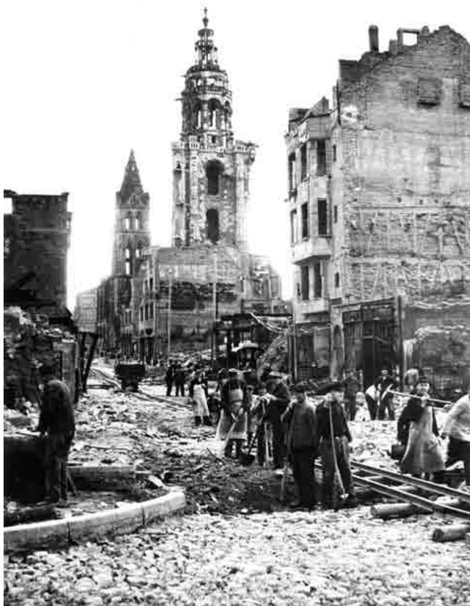
Trümmerräumung durch den Ehrendienst in der Kaiserstraße.