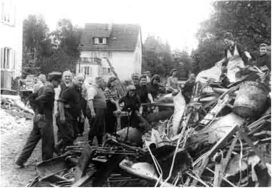
Aufräumarbeiten auf der „Fleiner Höhe“, September 1944.

geht indes hervor, dass NSDAP-Kreisleitung und -Ortsgruppen nach den Luftangriffen im September 1944 die Heilbronner Betriebe aufriefen, ihre Mitarbeiter (einschließlich der Zwangsarbeiter) für Bergungs- und Aufräumarbeiten zur Verfügung zu stellen. Vor allem an den beiden Wochenenden nach den Angriffen vom 10. September 1944 arbeiteten nicht nur weibliche und männliche Angestellte der Heilbronner Betriebe im so genannten „Ehrendienst“, sondern auch zahlreiche Schülerinnen und Schüler der Heilbronner Schulen bzw. Mitglieder der Hitler-Jugend. 16 Während des Dritten Reiches wurden Frauen also als „Trümmerfrauen“ (diese Bezeichnung setzte sich jedoch erst nach dem Ende des Zweiten Weltkriegs durch) bei Aufräumarbeiten eingesetzt, wie auch die Fotos von Trümmer räumenden Frauen auf der Fleiner Höhe im Steinhilber-Nachlass dokumentieren. 17