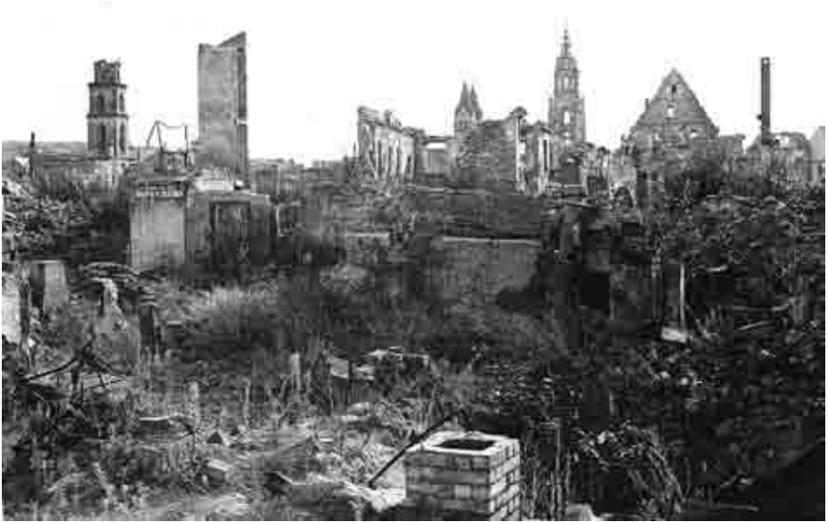
Die zerstörte Heilbronner Altstadt.

abgestellt. Neben Polizei, Feuerwehr, freiwilligen Helfern aus Heilbronn und den Landgemeinden sowie Häftlingen aus Neckargartach und Zwangsarbeitern wurden zwei Tage nach dem Bombenangriff auch 140 Mann des Reichsarbeitsdiensts 23 zur Räumung der wichtigsten Zufahrtsstraßen eingesetzt.