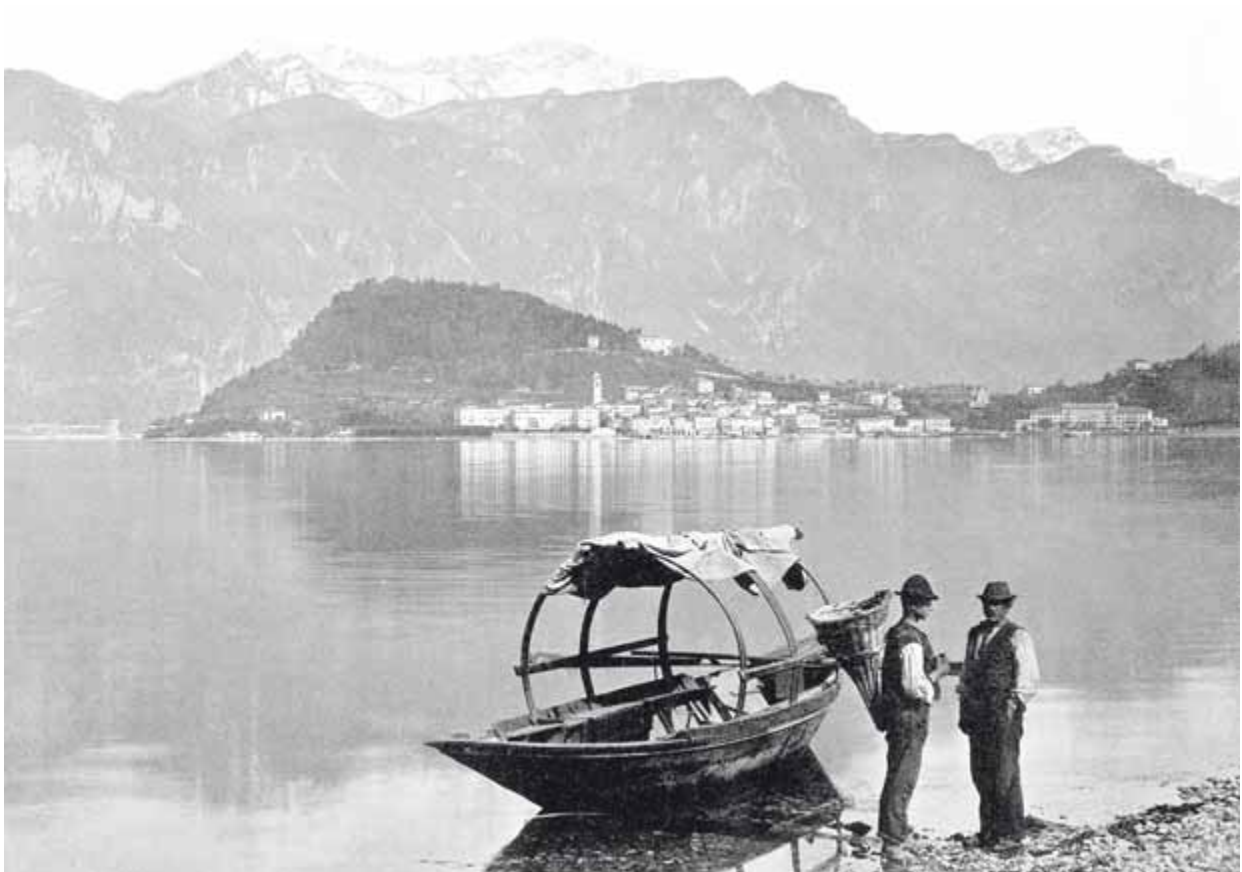
Bellagio am Comer See - von hier stammten die Venino und die Bianchi, die sich in Heilbronn niederließen.