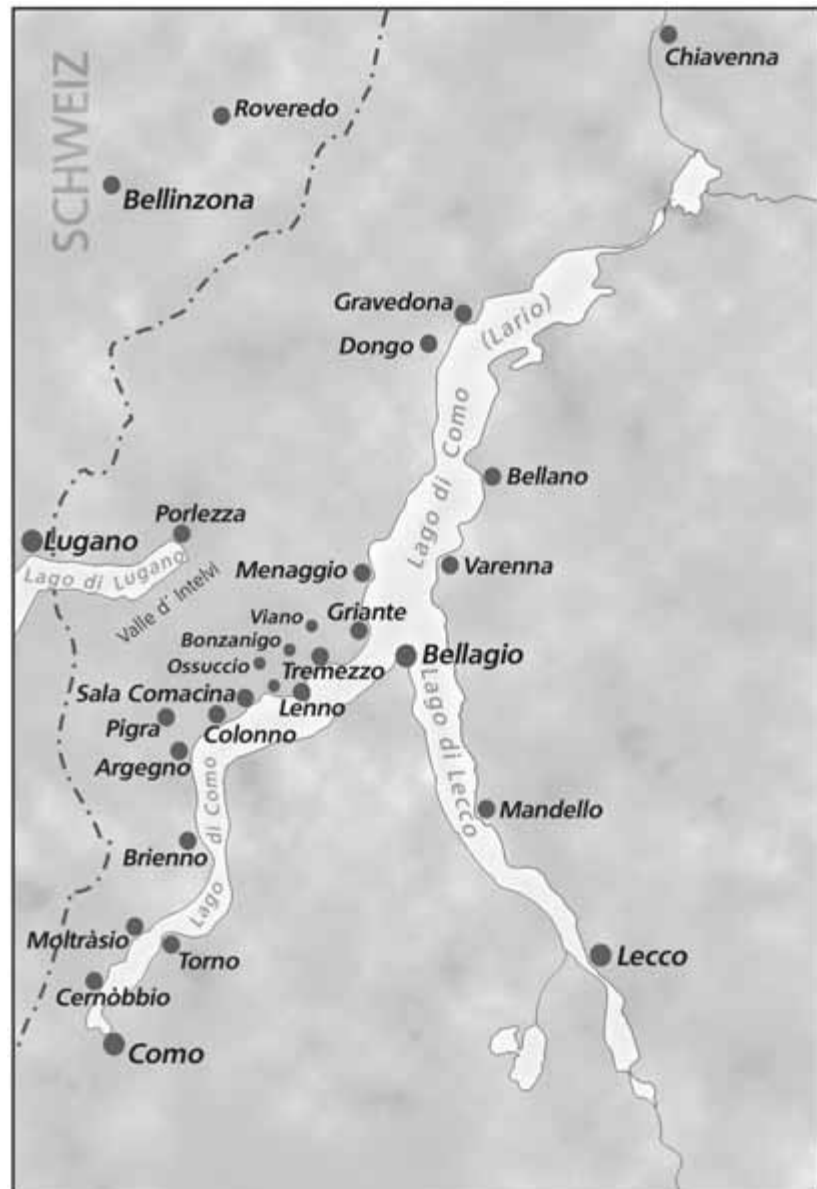
Der Comer See – von hier stammte ein Teil der italienischen Händler, die seit Beginn des 17. Jahrhunderts nach Südwestdeutschland kamen.

dann aus Italien nach, nachdem die Ehemänner in einer Stadt sesshaft geworden waren, weil häufig die Bürgerannahme von der Anwesenheit der Ehefrau abhängig gemacht wurde.