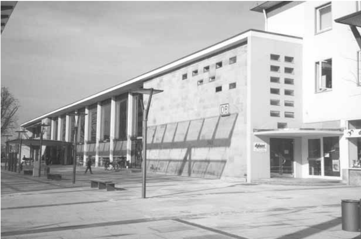
8 Bahnhof, Aufnahme 2002

seines Vorgängers Schuh nur unwesentlich, gleichwohl gilt er als Schöpfer, zumindest aber als Erbauer des heutigen Hauptbahnhofs (Abb. 8).