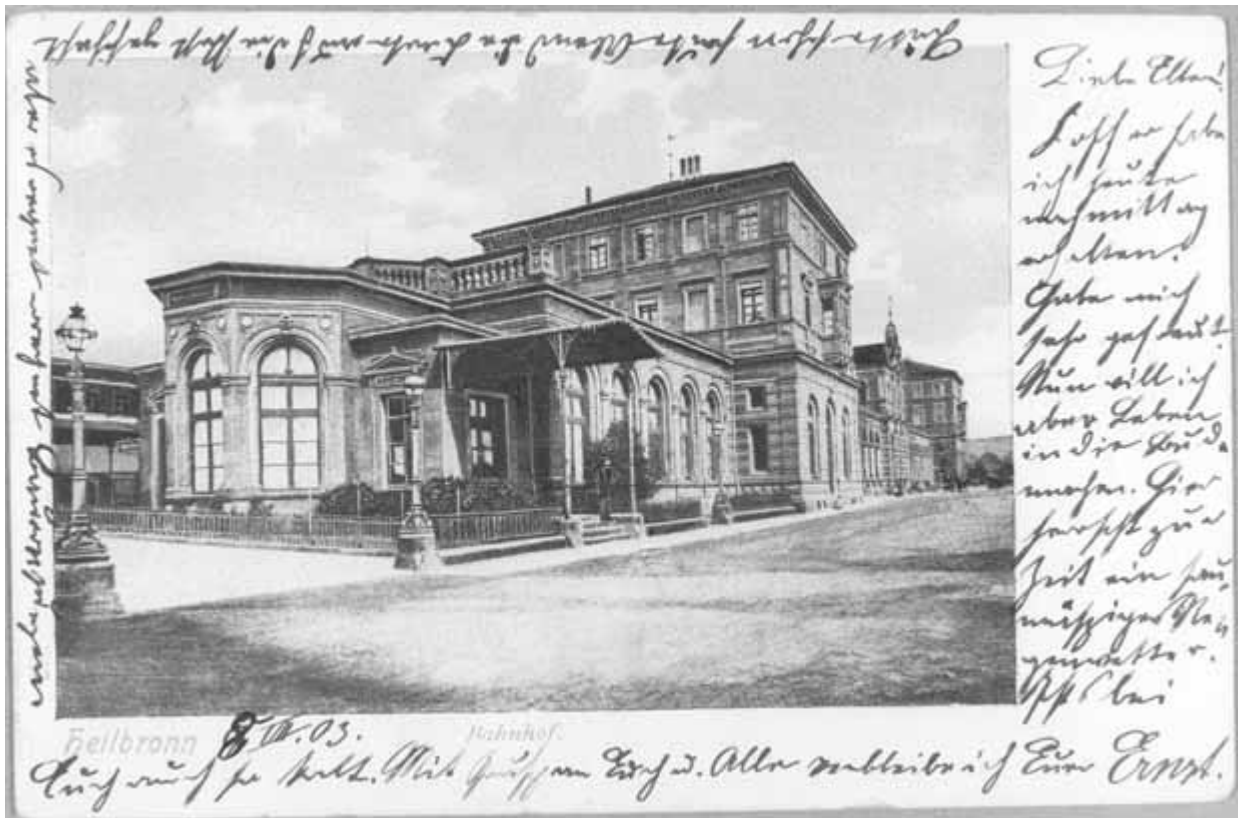
6 Bahnhof, Anbau mit „Salon für hohe Herrschaften“, um 1900

die Teilnahme an einem Gottesdienst in der Garnisonskirche (Friedenskirche) sowie den Besuch des Offizierskasinos an der Bismarckstraße muss der König in zügigem Tempo absolviert haben, denn um 13:50 Uhr reiste er wieder aus Heilbronn ab. 21 Falls noch Zeit blieb, hat er sicher auch einen Blick in den „Salon für hohe Herrschaften“ am Bahnhof geworfen. Er befand sich am Ende des linken (westlichen) Anbaus und zeichnete sich durch einen apsidenartigen Abschluss aus (Abb. 6). In einem solchen „Fürstenpavillon“ warteten die Herrschaften standesgemäß und getrennt vom gewöhnlichen Publikum auf die Abfahrt ihres Zuges.