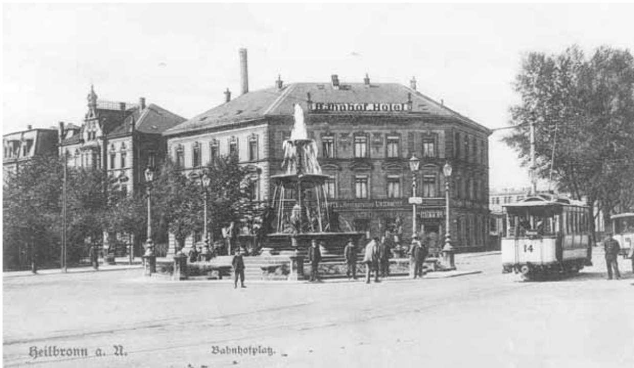
5 Löwenbrunnen vor dem Bahnhof mit eingeschalteter Fontäne, um 1900

daß von Anfang an nicht beabsichtigt war, jeden Tag aus allen Vorrichtungen Wasser ausströmen zu lassen, daß aber, wenn durch das Stadtbauamt Veranlassung genommen sein wird, der Brunnen wenigstens an Sonn- und Festtagen innerhalb gewisser Stunden in vollständigen Betrieb gesetzt werden sollte, was von Herrn Oberbürgermeister zugesagt wird. 16