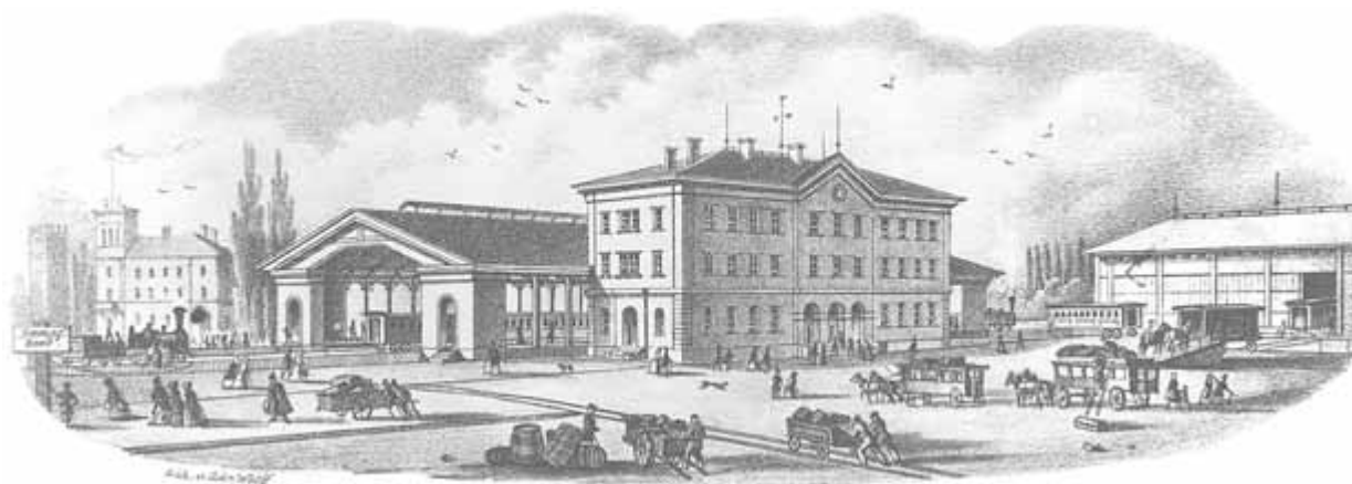
2 Bahnhof mit „Einsteigehalle“, Ansicht von Nordosten. Lithographie der Gebrüder Wolff um 1848/49

Breymann machte allerdings die Rechnung ohne seinen Chef, den Oberingenieur Karl Etzel, der die Verantwortung für die gesamte Nordbahn inne hatte. Zwar wählte er einen von Breymann favorisierten Standort auf dem linken Flussufer, allerdings richtete er die Trasse nicht nach Norden aus, wo sie am Hafen vorbei hätte weitergeführt werden können, sondern er führte sie nach einem großen Bogen geradewegs auf die Stadt zu. Hinzu kam, dass Etzel das Empfangsgebäude für diesen Bahnhof in Seitenlage erstellte, so wie es damals üblich war, wenn man an eine spätere Weiterführung dachte. Aber gerade das war ja in diesem Fall nicht möglich! Die Beweggründe für diese Entscheidung sind unklar.