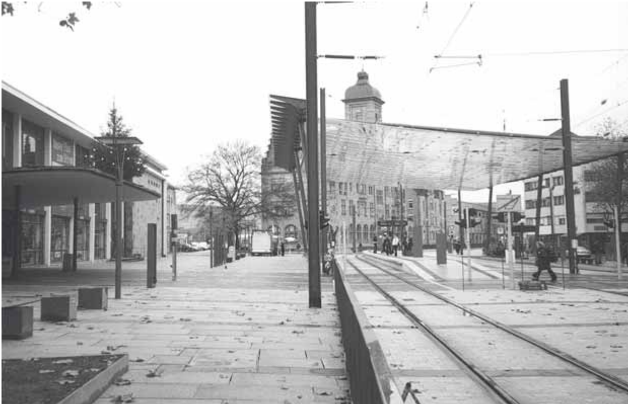
10 Glasdach auf dem Bahnhofsvorplatz, Aufnahme 2001

des „Schmuddel-Image“ gleich im Keim zu ersticken. Vielleicht braucht es einfach nur Optimismus im Blick auf das Ganze, um erst gar keine „Alltags-Wehwechen“ aufkommen zu lassen. Oberbürgermeister Paul Meyle brachte in seiner Rede zur Einweihung des Bahnhofs und des Vorplatzes am 12. Juni 1958 die Aufbruchstimmung von Seiten der Stadt auf den Punkt: