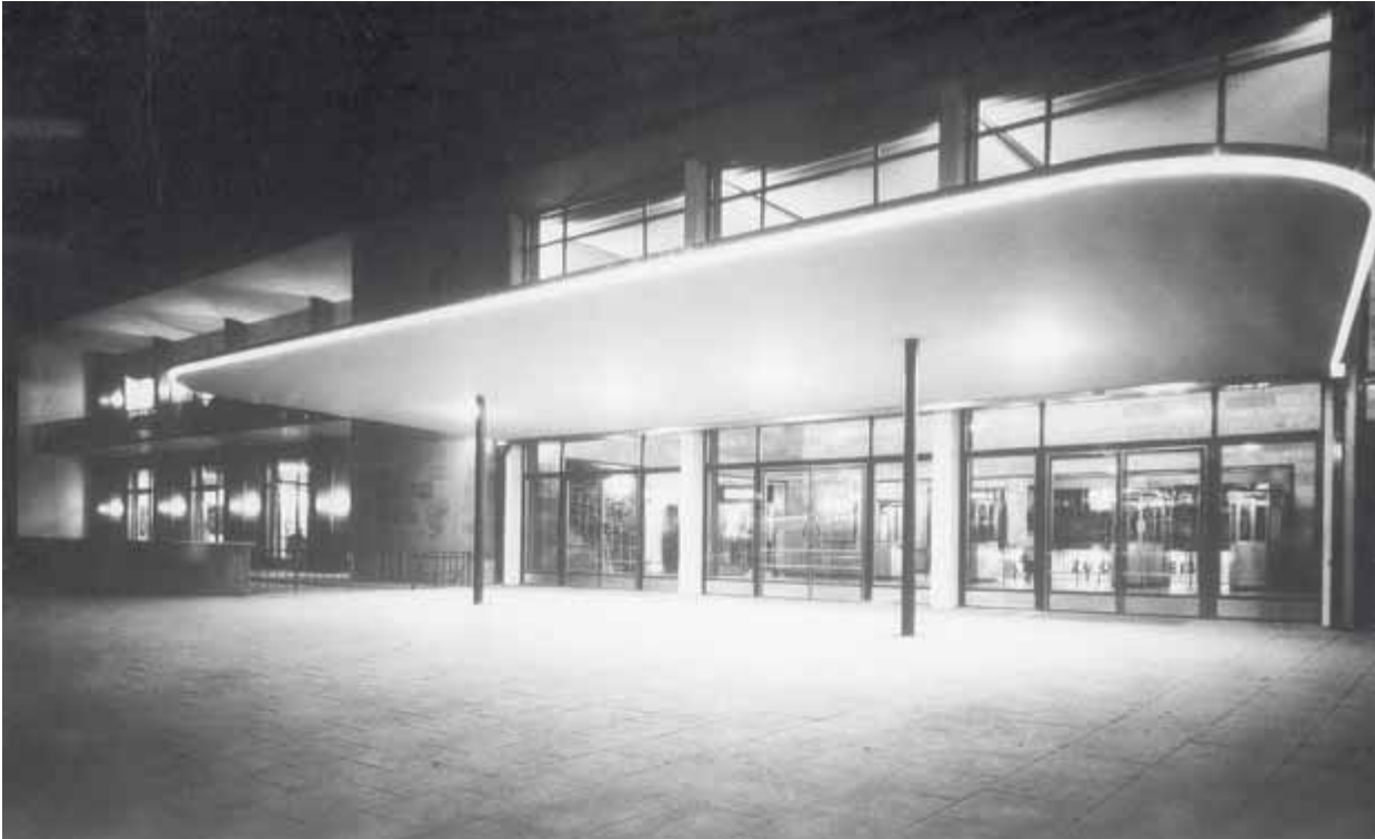
9 Flugdach mit eingeschalteter Effektbeleuchtung, 1958