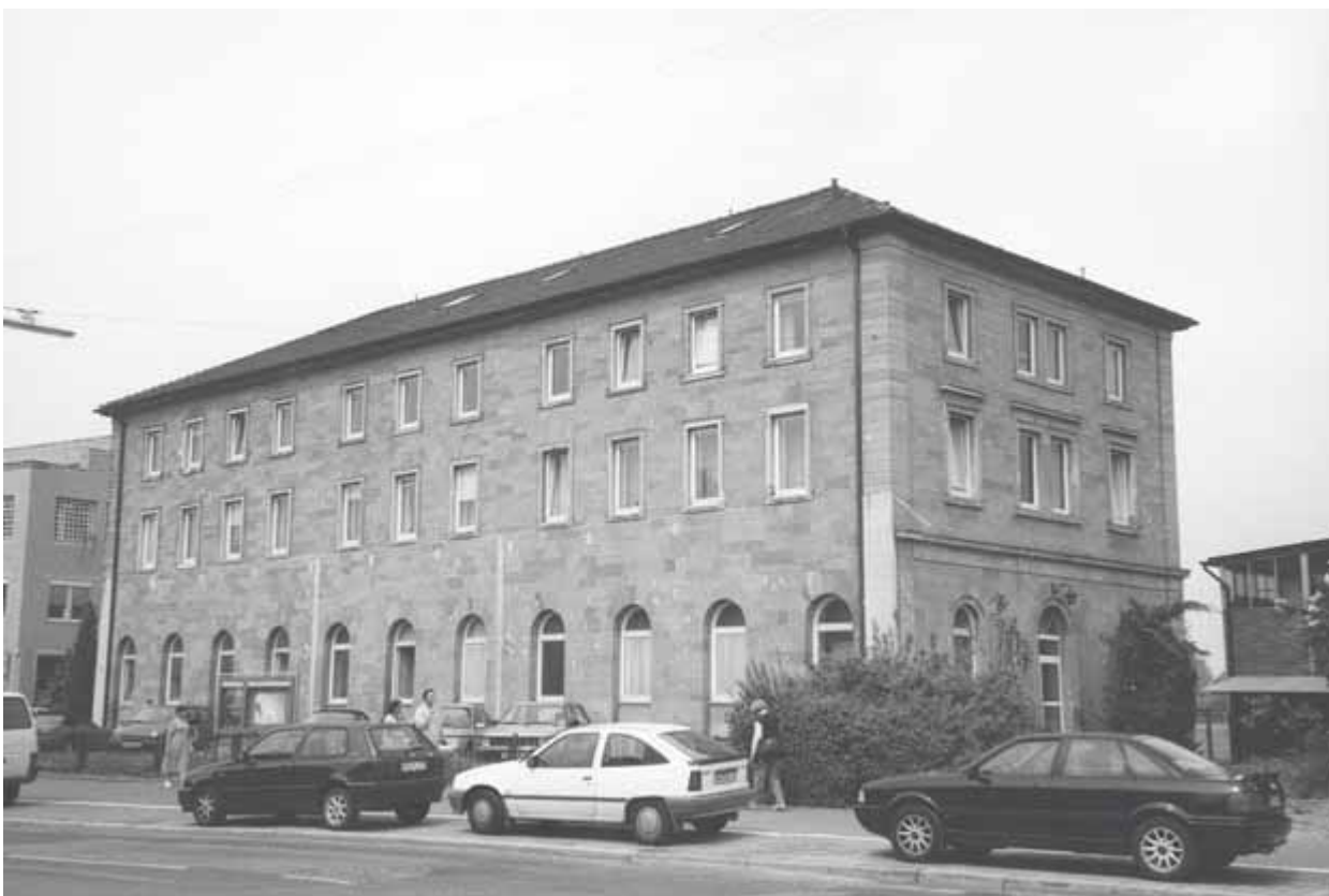
1 Erster Bahnhof, 1848 erbaut von Karl Etzel. Aufnahme 2000

Thema der folgenden Betrachtungen sind die drei Empfangsgebäude des Heilbronner Hauptbahnhofs von 1848/49, 1874 und 1958. Dabei stehen Äußerungen und Kommentare der Menschen im Mittelpunkt, die unmittelbaren zeitlichen oder sogar persönlichen Bezug zu den Gebäuden hatten. Zusammen mit einigen ausgewählten „Kuriositäten“ entsteht so ein lebendiges Bild der Bahnhofsgeschichte, das dennoch mittels kritischer Untersuchung und Hinterfragung auch wissenschaftlichen Ansprüchen genügt. Grundlage ist die im Oktober 2003 erschienene kunsthistorische Dissertation des Verfassers „Der Bahnhof Heilbronn – seine Empfangsgebäude von 1848, 1874 und 1958“.