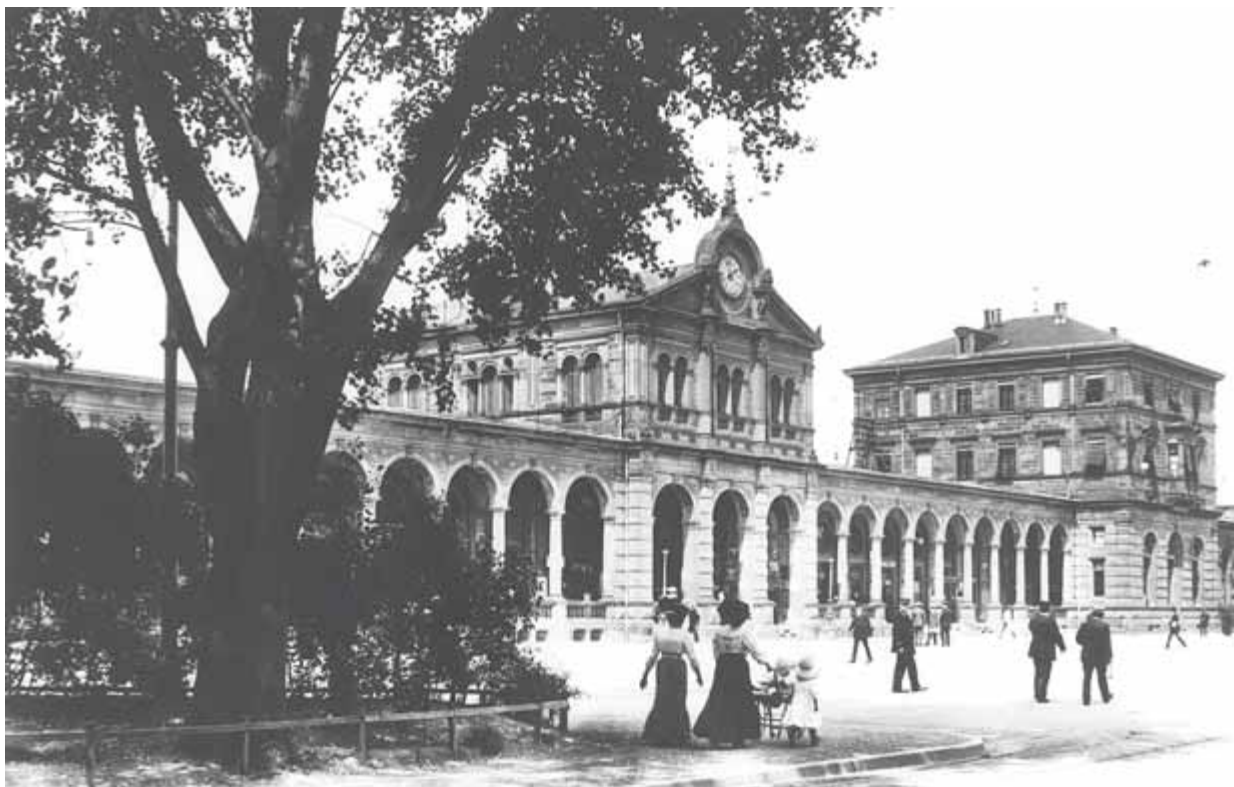
3 Zweiter Bahnhof, 1874 erbaut von Schurr und Bonhöffer, Aufnahme 1911

Mengen Wasser aus der Tunnelbaustelle liefen. Die Stadt dachte praktisch und sah die Möglichkeit, das Wasser gezielt in die städtische Brunnenleitung zu führen. Als gar das Gerücht auftauchte, es handle sich um eine Mineralquelle, die bei den Grabarbeiten angezapft wurde, entstand in der Bevölkerung eine regelrechte Hysterie angesichts der zu erwartenden wirtschaftlichen Ausbeutungsmöglichkeiten. Der Brunnen wurde gefasst und der Bevölkerung im Frühsommer 1863 erlaubt, morgens von 5 bis 8 Uhr und nachmittags von 4 bis 7 Uhr mit eigenen Gefäßen das vermeintlich kostbare Nass zu schöpfen (täglich zwei Krüge zu je drei Schoppen waren gratis). Aufsicht hatte die Frau des Bahnwärters Kirchner am Posten 70 der mittlerweile fertiggestellten Bahnstrecke. Kurze Zeit später versiegten die Schriftquellen zum Thema „Mineralquelle in Heilbronn“ schlagartig. Nur die Verdolung des Abflusses 1863 scheint noch gesichert. Dies deutet darauf hin, dass der wahre Wert des Wassers mittlerweile erkannt worden war. 12