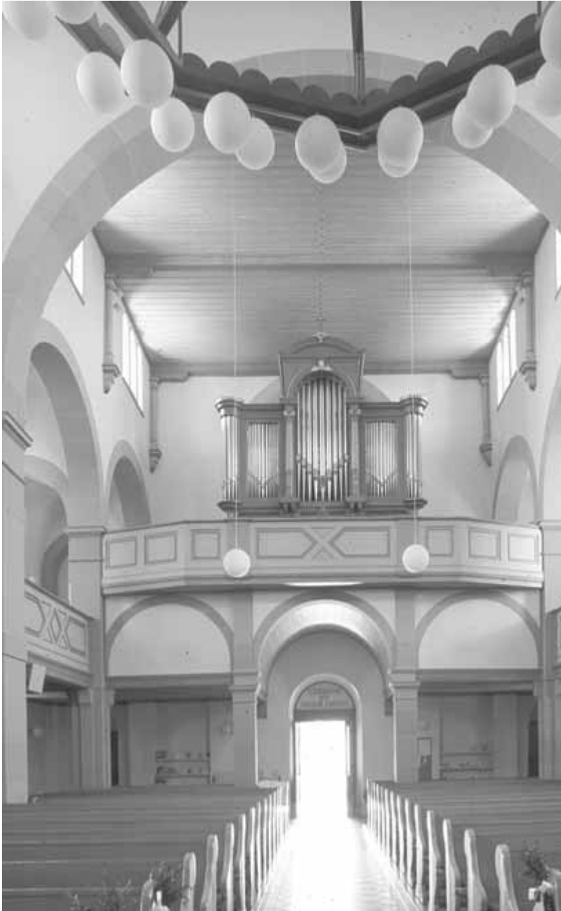
7 Eppingen, Pfarrkirche, Inneres

heim seinen Kreisstatus, und das seit dem Mittelalter kurpfälzische beziehungsweise badische Eppingen wurde nun dem Landkreis Heilbronn zugeschlagen.