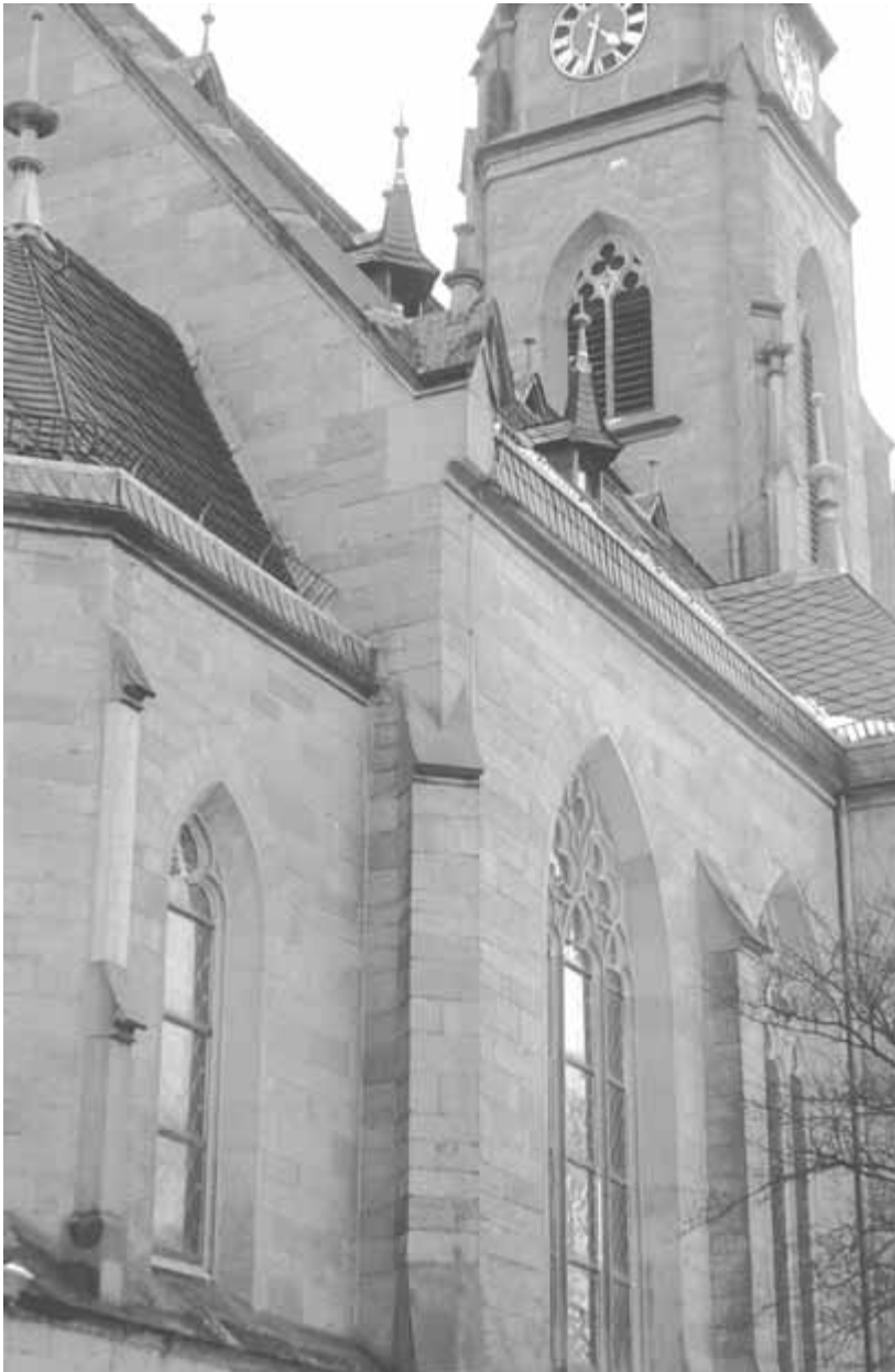
10 Bad Rappenau, Pfarrkirche, Ansicht von Nordosten

leicht ausgestelltes Querhaus werden durchgängig von Strebepfeilern und Fialen gegliedert, der Chor endet flach und öffnet sich in einem großen Maßwerkfenster.