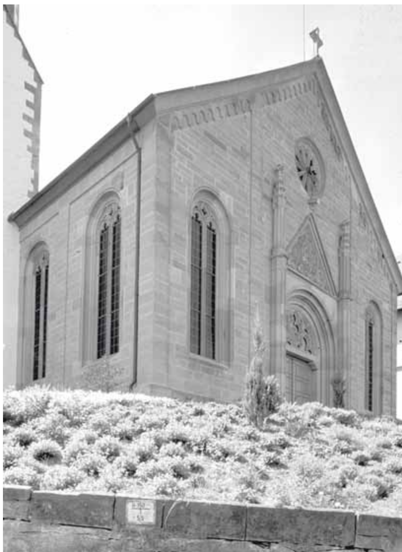
3 Neckarwestheim, Pfarrkirche von Nordwesten

Der Westturm tritt deutlich vor die Kirchenfassade und dominiert mit seinem Uhrengeschoss, den Schallarkaden und der spitzen Haube die Dorfmitte. Fein aufeinander abgestimmt die tief eingeschnittenen Fensternischen, durch rote und gelbe Werksteine herausgestellt die Bögen. Giebellinie und oberer Abschluss der Langhauswände sind durch Blendbogen herausgehoben. Anzunehmen, dass es sich um die Arbeit eines der badischen Landbauräte gehandelt hat.