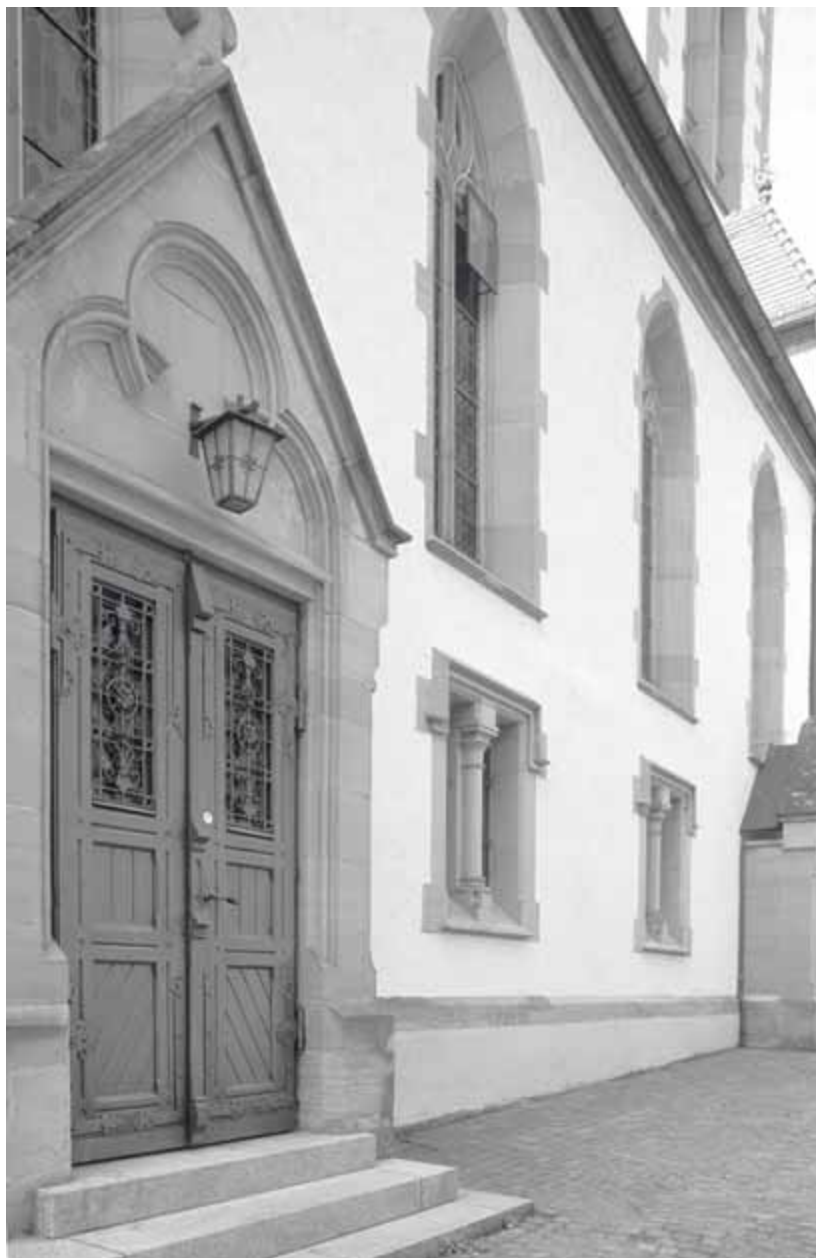
12 Möckmühl, Pfarrkirche, Langhaus von Nordosten

zig begutachtete er, 17 Gotteshäuser schuf er neu. 38 Seit 1878 zudem im Vorstand des einflussreichen Stuttgarter „Vereins für die christliche Kunst in Württemberg“, bestimmte er neben Leins die Leitlinien des evangelischen Kirchenbaus im Lande.