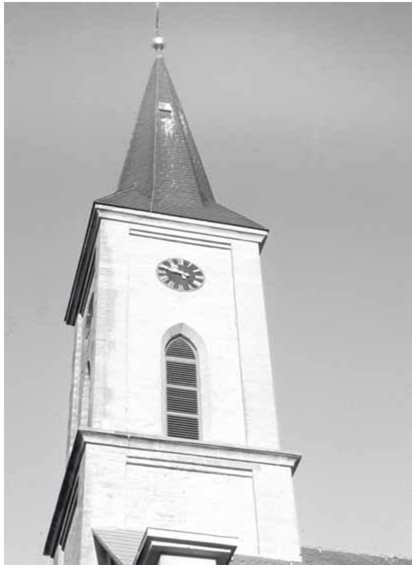
4 Richen, Pfarrkirche, Turm- obergeschoss