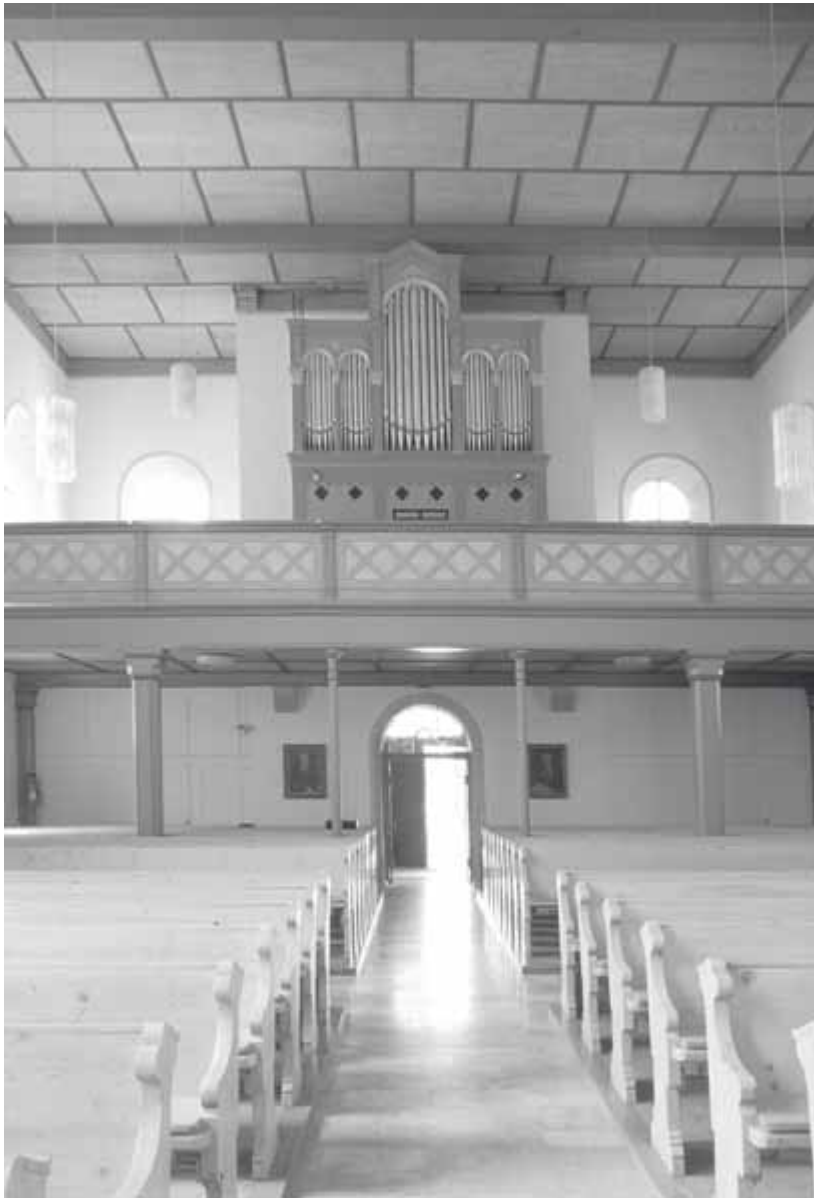
6 Züttlingen, Pfarrkirche, Inneres

läden. Die Züttlinger Kirche wirkt auch im Innern mit ihrer breiten Orgelempore über der Eingangsseite und der Flachdecke nüchtern und lässt ihre Besucher sich ganz auf den Altarraum konzentrieren.