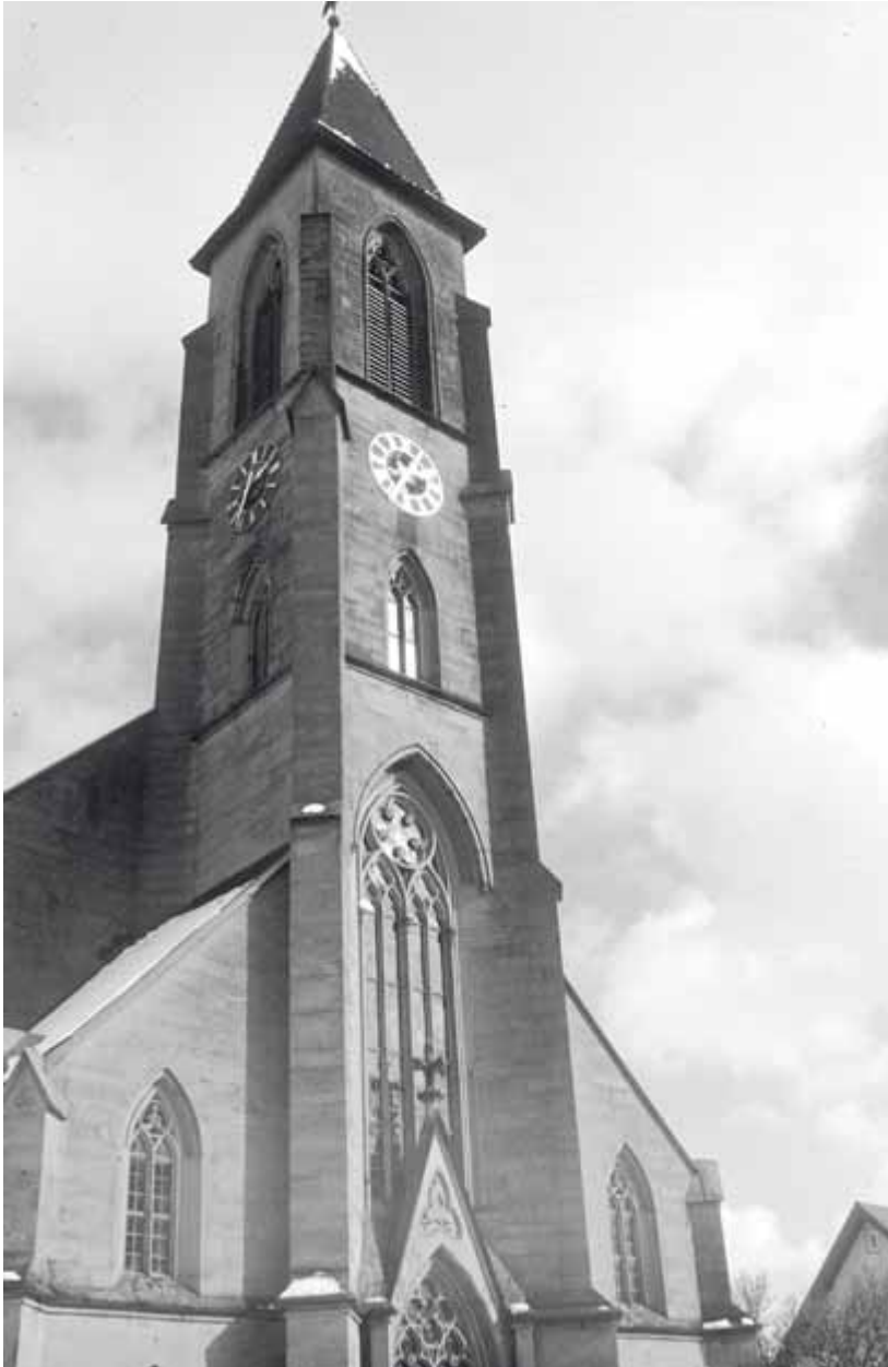
9 Fürfeld, Pfarrkirche, Ansicht der Westseite

auf kreuzförmigem Grundriss entworfen. Durch die raffinierten Übergänge von den Seitenschiffen zum Querhaus entsteht der Eindruck einer achteckigen Vierung. Auch bei diesem Bau ist das Rundbogenmotiv das alles bestimmende Moment: Rundbogige Arkaden stützen die Orgelempore, Rundbogen öffnen den Raum zu den Seitenschiffen, Gruppen von rundbogigen Drillingsfenstern lassen das Licht im Obergaden ins Schiff herein und auch Fassade und Turmobergeschosse sind von Bogenformen dominiert. Bis in höchste Höhen setzen die runden Abschlüsse dem steil aufsteigenden Turm beruhigende, manchmal aber auch etwas kleinteilige Akzente entgegen.