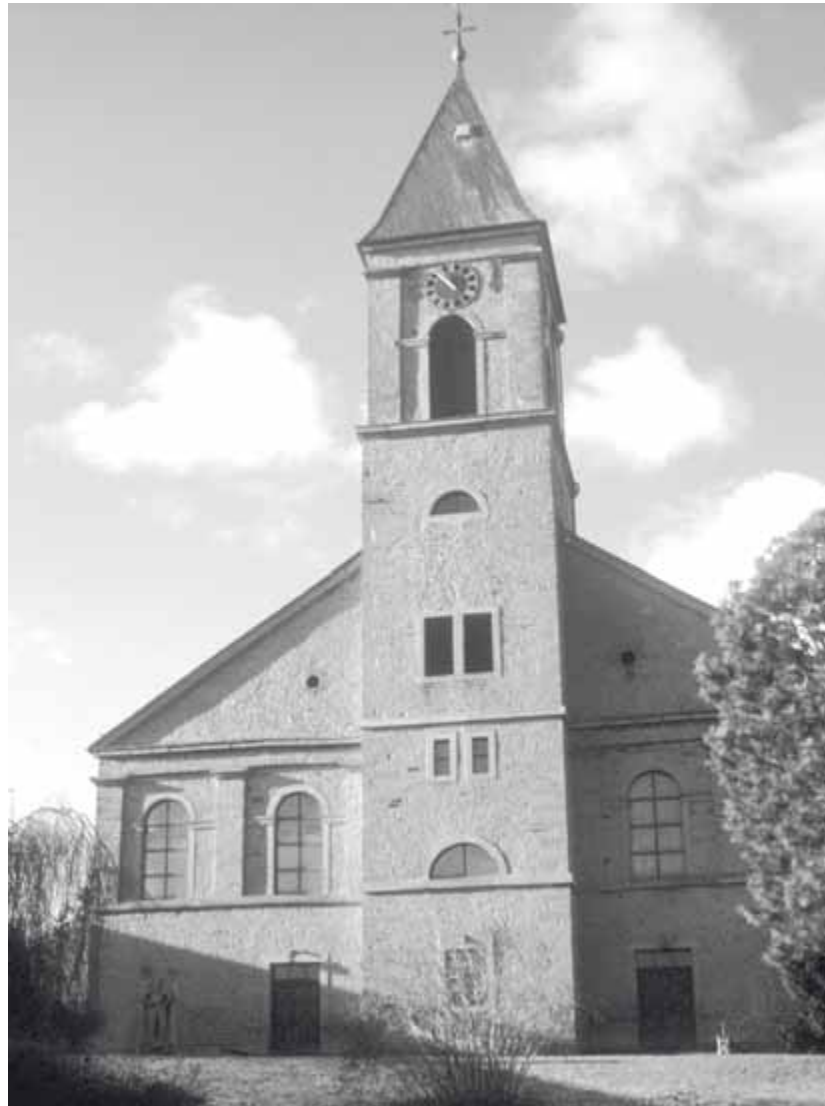
1 Adelshofen, Pfarrkirche, Ostseite mit Turm

und empfängt sein Licht von oben. Englische Vorbilder haben diese Architektur angeregt und weitgehend auch die gefällige Innenausstattung beeinflusst.