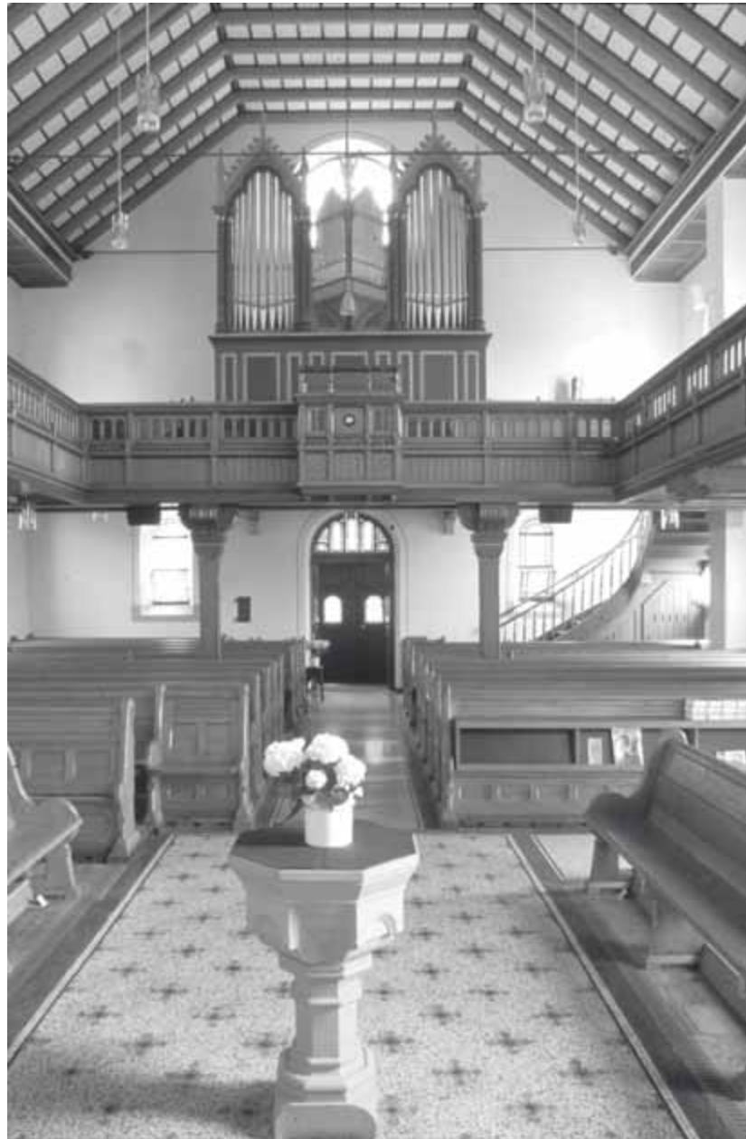
14 Roigheim, Pfarrkirche, Inneres nach Westen

Tympana, die Spätzeit des Historismus markierend. Eine wuchtige Orgelempore in hölzernem Maßwerk akzentuiert das Innere des Schiffs, das mit einer gebrochenen hölzernen Kastendecke abschließt.