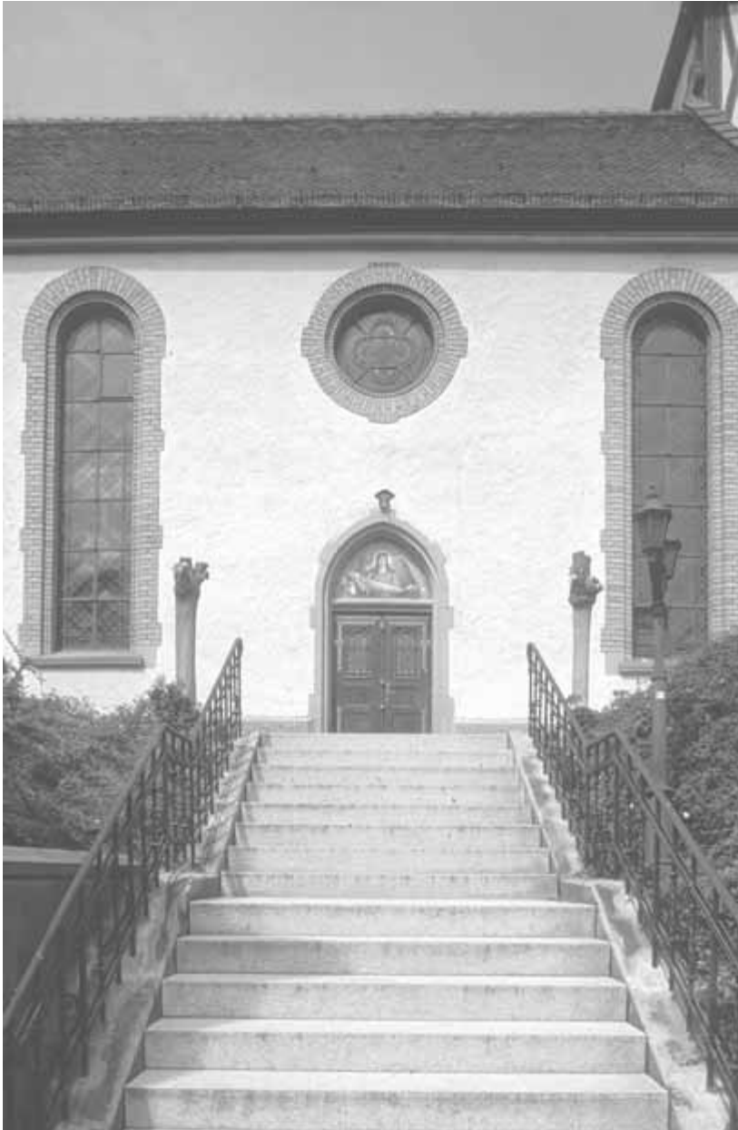
13 Roigheim, Pfarrkirche, Ansicht von Süden

verfuhr Dolmetsch dabei bis nach der Jahrhundertwende in stilpurifizierender Weise. Dies führte häufig zu einer Zerstörung einzelner Ausstattungsteile [...] oder zu einer Übermalung mittelalterlicher Wandmalereien. Erst nach 1903 lässt sich bei ihm eine vorsichtige Revidierung dieser Haltung beobachten.“ 39