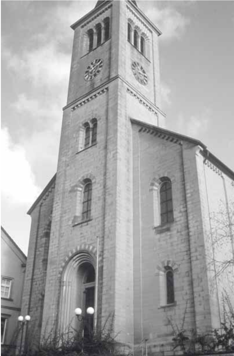
2 Elsenz, Pfarrkirche, Westseite

Fenster gliedern die gerundete Westseite. Der Grundriss folgt dem Gedanken der Predigtkirche: Durch eine halbrund geschlossene Wand sind alle Stühle konzentrisch um den Platz des Pfarrers angeordnet. Die Anlage der recht seltenen Halbkreiskirchen kam um 1820 auf, wie eine in diesem Jahr in Liebenstein im Herzogtum Sachsen-Meiningen gebaute Kirche und ein von Leins 1837 entworfener Dom belegen. Die Adelshofener Kirche wurde zwischen 1830 und 1834 zu einem Preis von 7750 Gulden errichtet. 23 Einzelne Details der Kirche verraten deutlich ihre Herkunft aus dem Karlsruher Klassizismus.