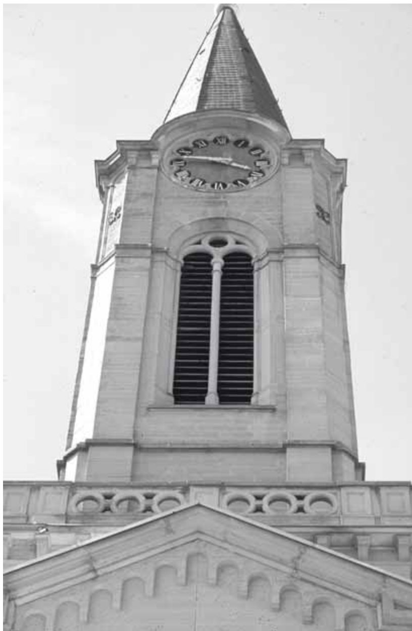
8 Eppingen, Pfarrkirche, Details des Turmobergeschosses

platz im Gewann „Roth“. 31 Am 22. Oktober 1876 konnte der Grundstein gelegt werden. Während der nächsten zwei Jahre wuchs die Kirche nach den Plänen des Karlsruher Bauinspektors Ludwig Diemer. 32 Er hatte einen klassischen Längsbau