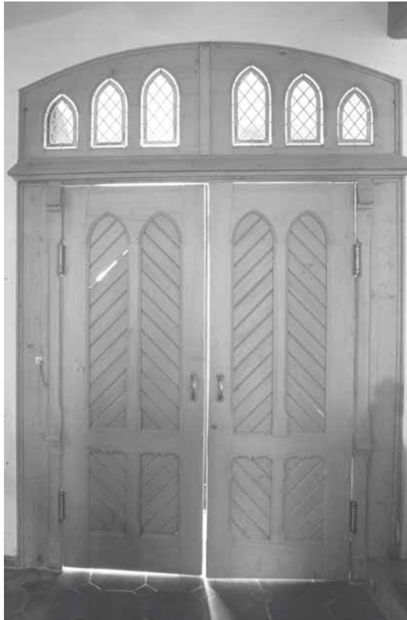
11 Widdern, Pfarrkirche, Portal von innen